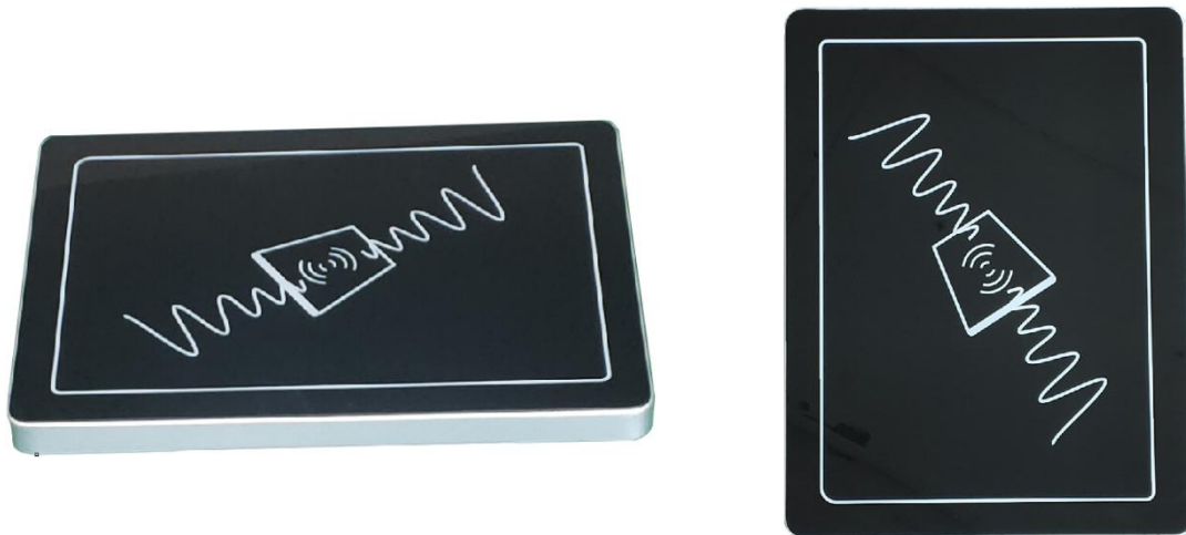
JT-6260 HF RFID 结算台产品图片